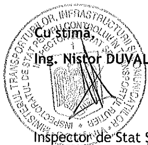
Inspector de Stat Șef

Inspectoratul de Stat pentru Controlul în Transportul Rutier